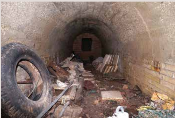
Refugi Port de Xàbia.