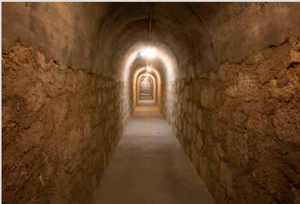
Refugi Cervantes, Alcoi.