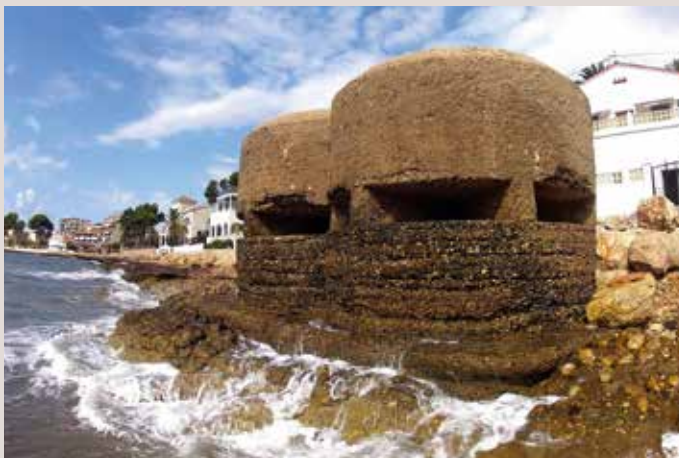
Niu de metralladora. Altea.