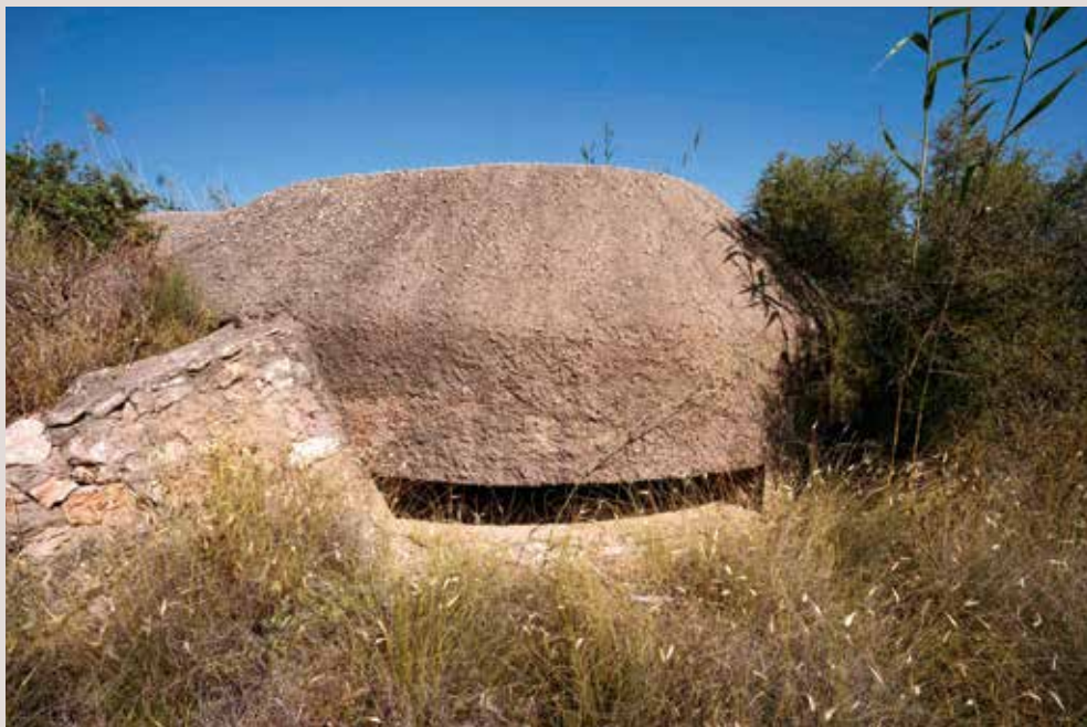
Clot de Galvany fortí.