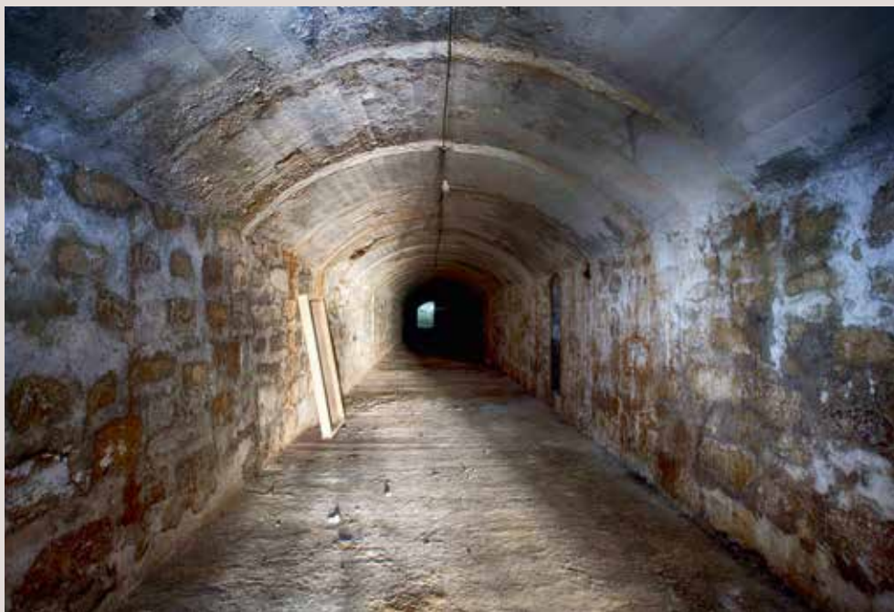
Refugi de la Glorieta. Alcoi.

Hores d'ara, tota aquesta arquitectura de guerra aquests conjunts defensius: búnquers, níus de metralladores, refugis antiaeris, etc., que hi ha escampats per bona part de les nostres comarques, formen part del nostre patrimoni, de la memòria històrica valenciana que hi ha que preservar i recuperar.