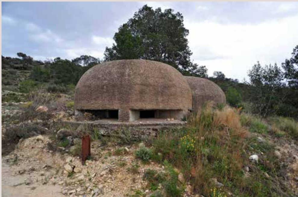
Bunker el Portitxol.