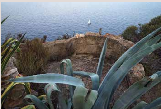
Plataforma antiàeria_Cap Sant Antoni.