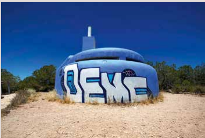
Cap de Santa Pola niu de metralladora.