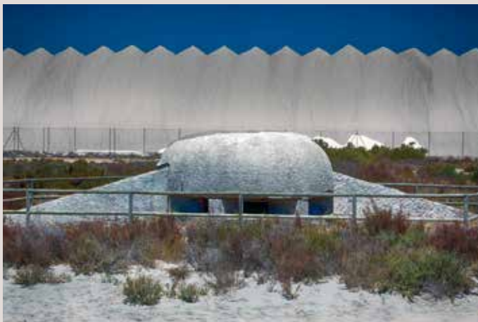
Santa Pola Platja del Tamarit.