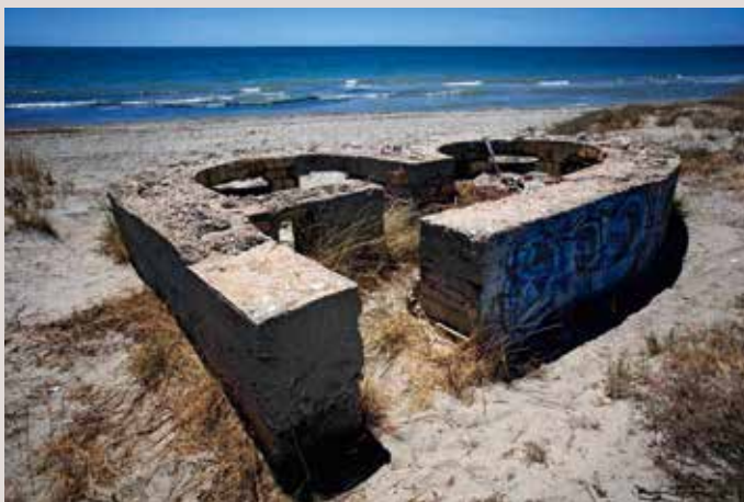
Santa Pola Platja del Tamarit.