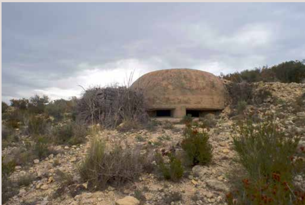
Bunker el Portixol.