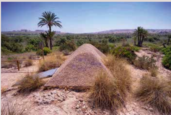
Clot de Galvany fortí.