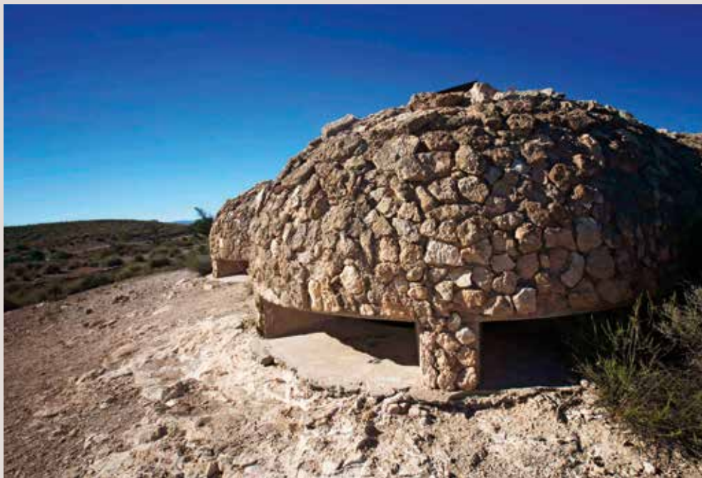
Niu de metradora en el Clot de Galvany.