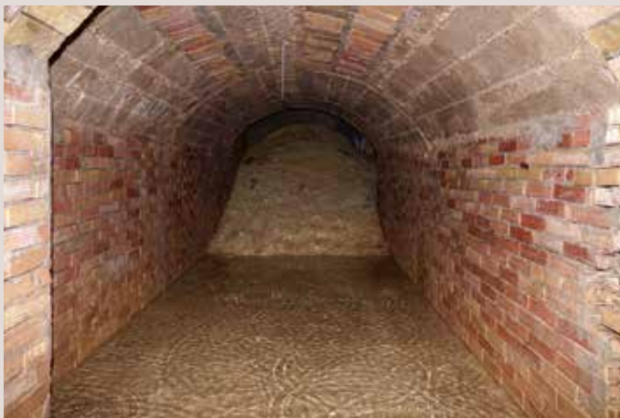
Refugi Port de Xàbia.