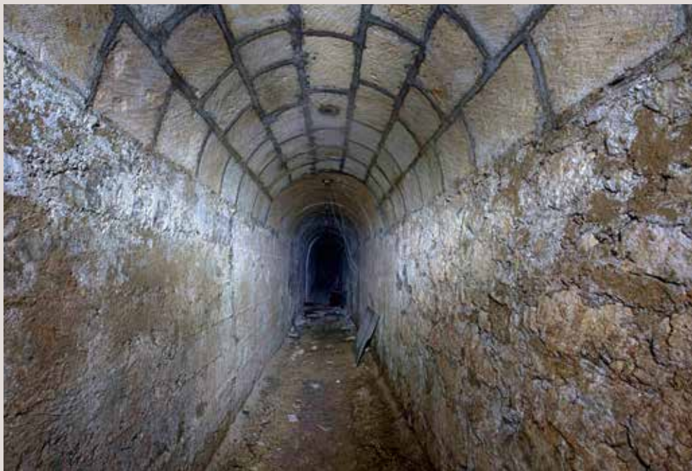
Refugi Carbonell, Alcoi.