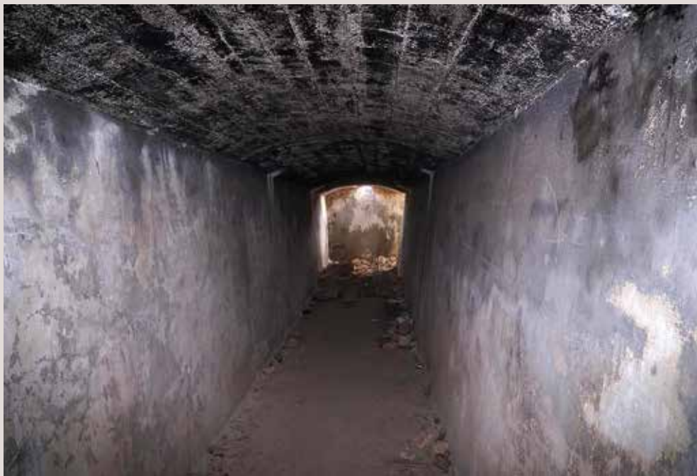
Bateria de costa en la Venta del "Burro" de Denia.