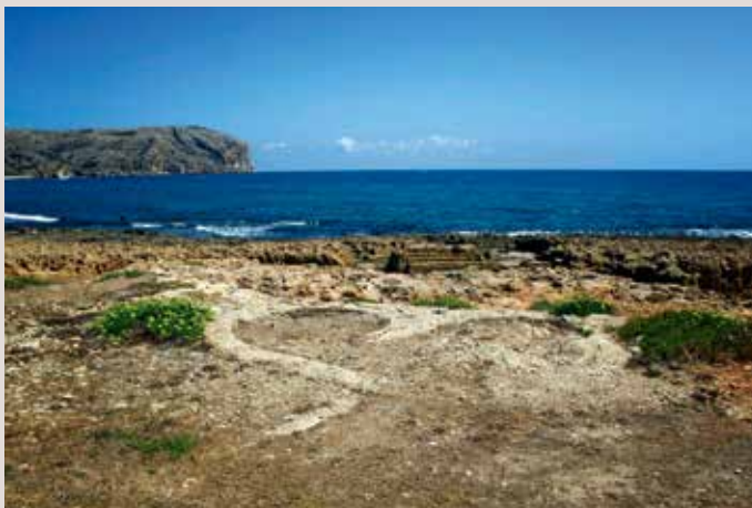
Silueta d'un fort, platja de Montañar, Xàbia.