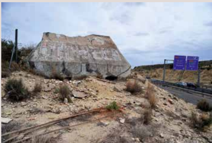
Bunker el Portitxol.