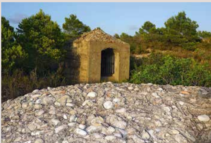
Bateria de costa en la Venta del "Burro" de Denia.