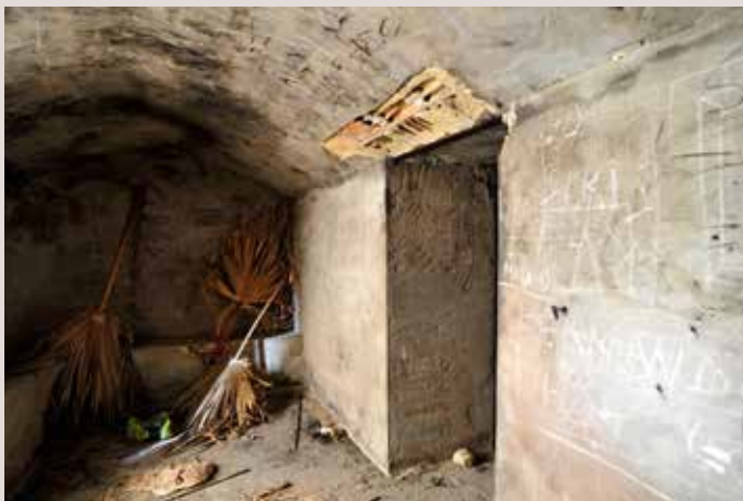
Bunker el Portitxol.