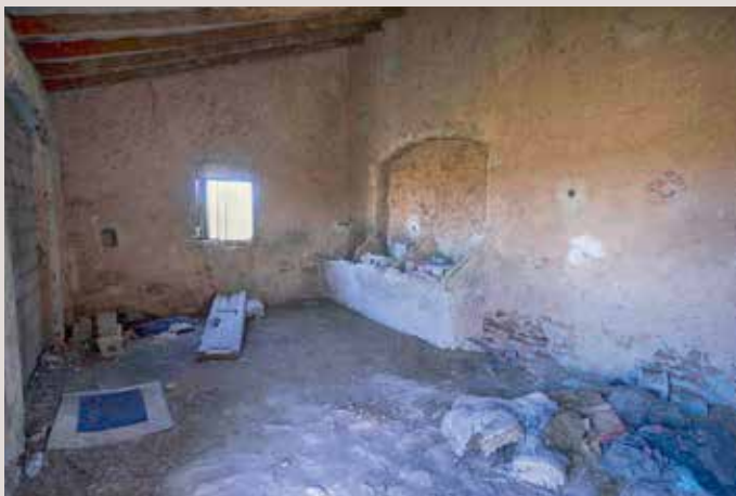
Clot de Galvany estable mulera.