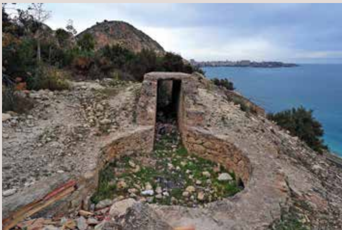
Plataforma antiàeria Alacant.