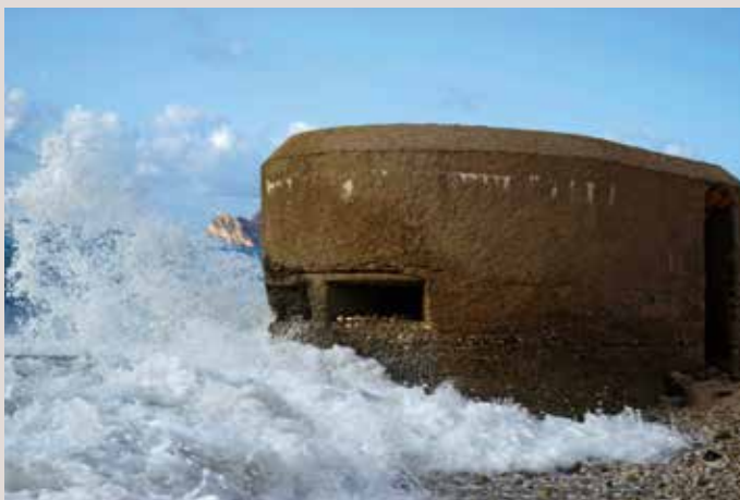
Niu de metralladora. Altea.