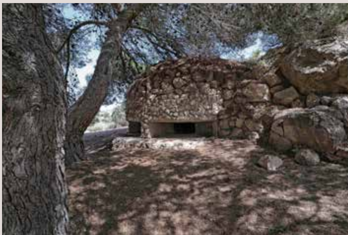
Clot de Galvany fortí.