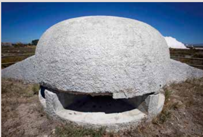
Santa Pola Platja del Tamarit.