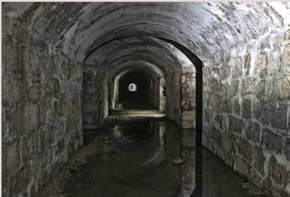
Refugi de Sant Domènec, Alcoi.