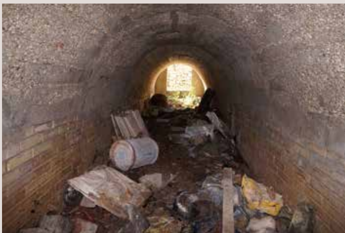
Refugi Port de Xàbia.