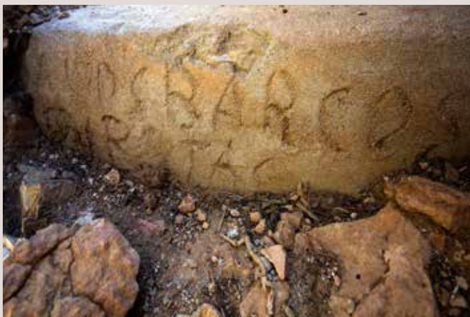
Inscrició Barcos... en el Cap de Santa Pola.