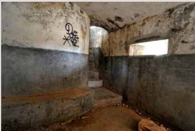
Niu de metralladora Cap de Santa Pola.