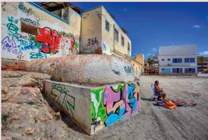
Santa Pola, Port.