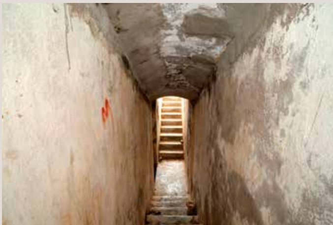
Cabo Santa Pola accés bateria de costa.