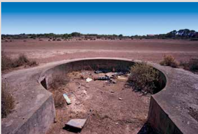
Clot de Galvany bateria antiàeria.