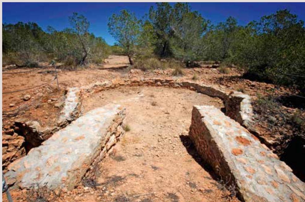
Cap de Santa Pola, bateria de costa.