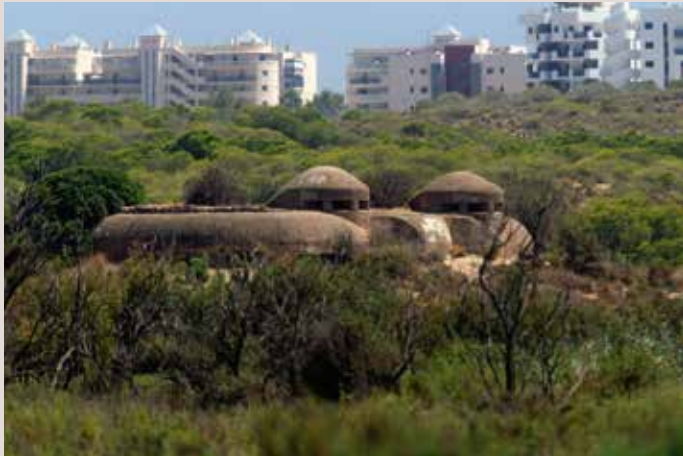
Clot de Galvany fortí.