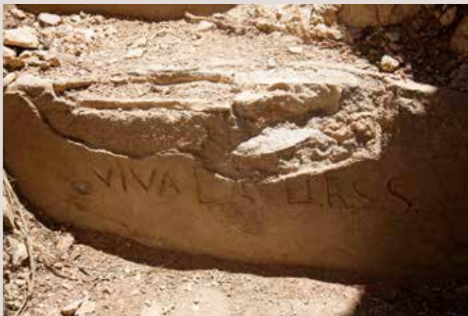
Cap de Santa Pola, inscripció "Viva la URSS".