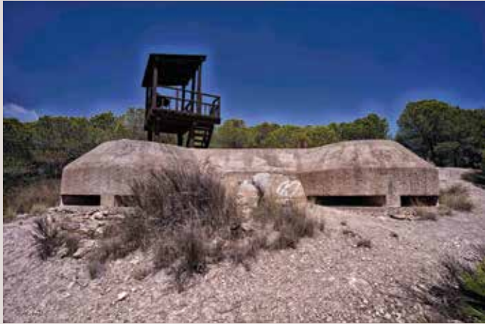
Clot de Galvany fortí.