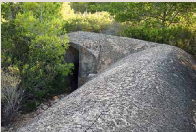
Bateria de costa en la Venta del "Burro" de Denia.