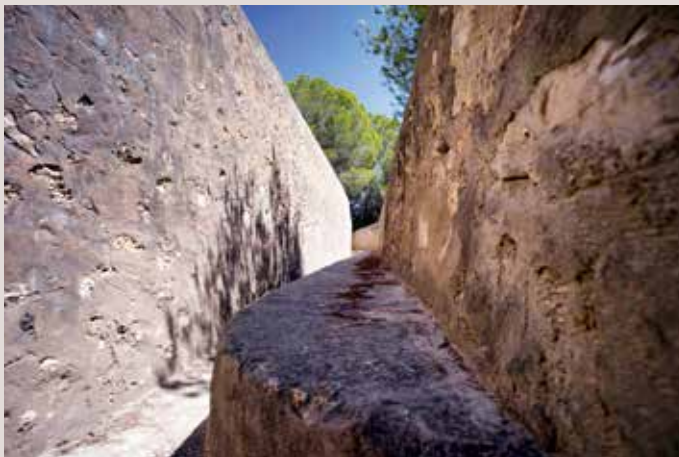
Clot de Galvany triutxera fortificada amb escala.