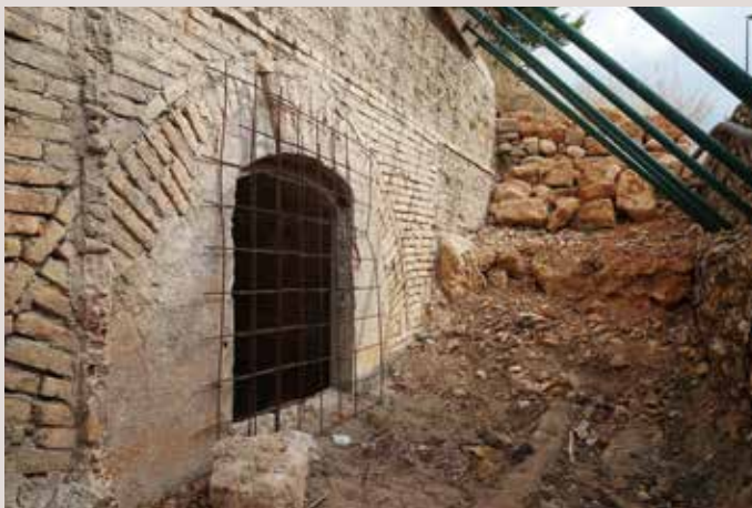
Refugi Port de Xàbia.