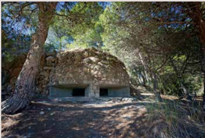
Clot de Galvany fortí.