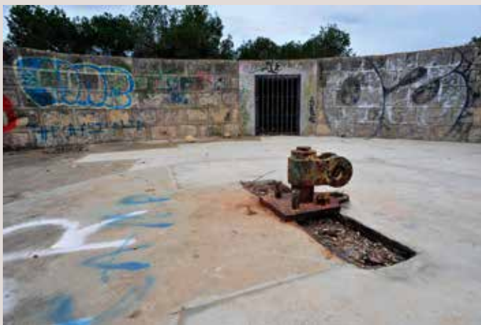
Bateria de Costa del Cap Santa Pola.