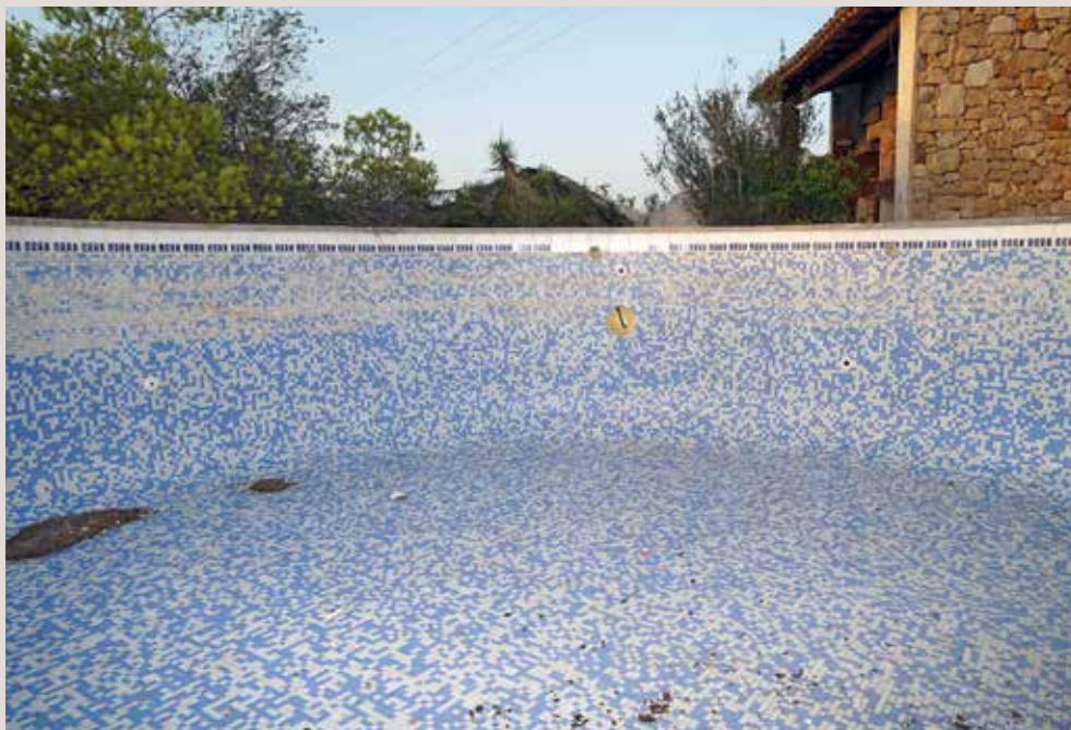
Bateria de costa en la Venta del “Burro” de Denia.