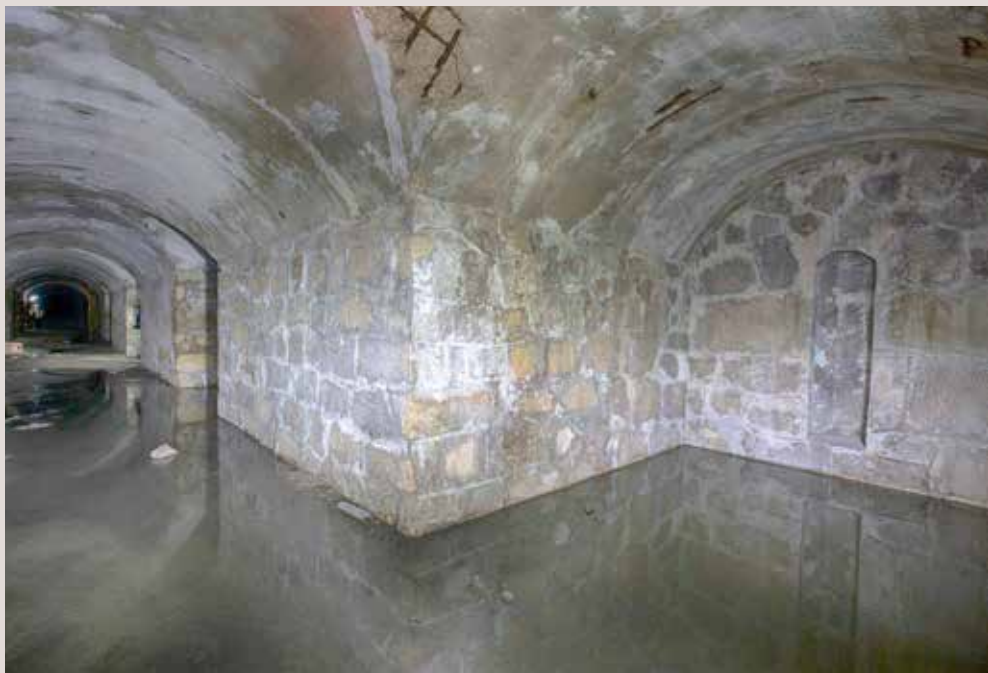
Refugi de Sant Domènec, Alcoi.